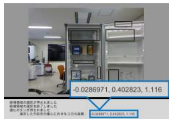
Fig.9 候補領域内の物体の3次元座標における重心位置