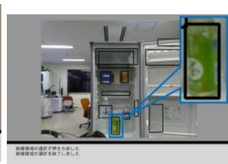
Fig.8 ユーザが最も好ましいと思う候補領域を決定