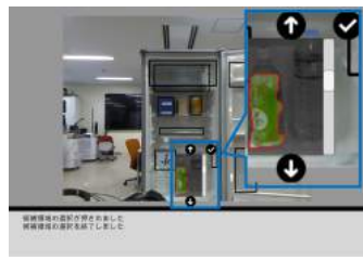
Fig.7 ユーザが最も好ましいと思う候補領域を選択中

上から二番目の「ロボットアームのアイコン」は候補領域内の物体の3次元座標における重心を求める処理(図9)が行われる。