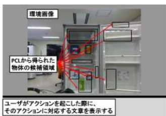
Fig.5 インターフェースシステム

人とロボットが情報共有を行うためには、ロボット側から得られた情報をユーザが理解できるように示す必要がある。そこで我々はユーザがロボットとの対話を画像の操作で行えるようなインターフェースシステムを作成した。本研究で作成したインターフェースは、RGB-D センサから取得した環境中の物体を自動で認識された結果をユーザのデバイスに画像で可視化する仕組みになっているので、ユーザは認識された物体領域にタッチなどのアクションを起こすことロボット側に情報を与えるシステムになっている。図5にユーザがロボットとの対話を行うために今回作成したインターフェースシステムを示す。